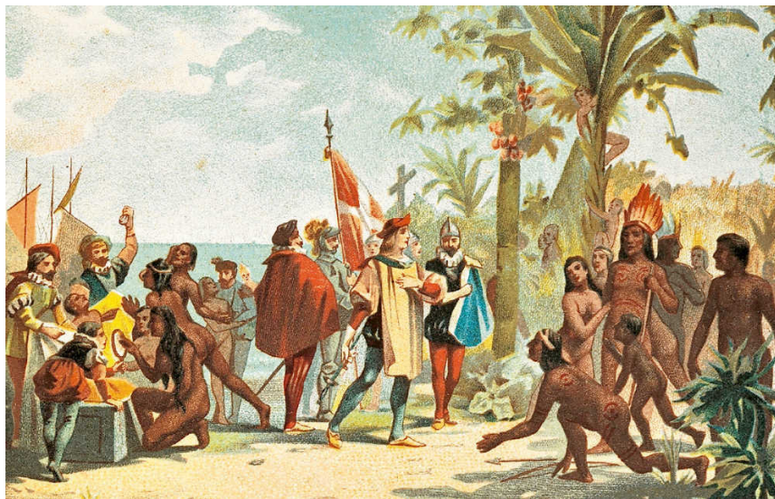
Una stampa d'epoca raffigurante Colombo in uno dei suoi sbarchi