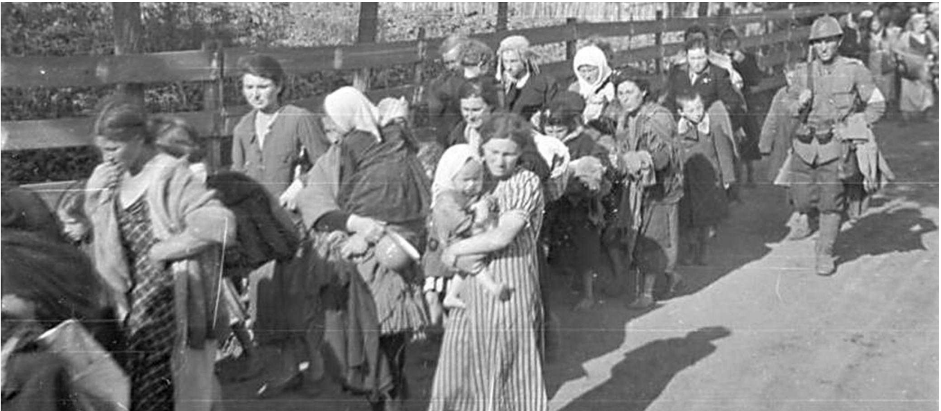
A sinistra, ottobre 1941, strage di Odessa: una colonna di civili ebrei deportati e scortati da soldati rumeni. Sopra, la copertina del romanzo di Ben Pastor