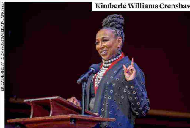
Kimberlé Williams Crenshaw

Avvocata per i diritti civili e docente universitaria, Kimberlé Williams Crenshaw è sempre stata abituata a rispondere a tono. Cosa fondamentale per sviluppare concetti come l'intersezionalità e la teoria critica della razza. Nel memoir Backtalker (Simon & Schuster) offre uno sguardo sfaccettato e franco sul ruolo che razzismo e discriminazione di genere hanno avuto sugli anni della sua crescita, nell'Ohio degli anni sessanta, e della sua formazione, prima alla Cornell university e poi a Harvard. Crenshaw scrive brevi capitoli, ognuno incentrato su una o