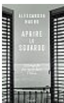
Alessandra Mauro Aprire lo sguardo Garzanti pp. 208 – euro 22

Vera, giornalista in crisi, e Andrea, accademico coinvolto senza colpa in uno scandalo, scoprono che un fatto di sangue avvenuto negli anni di piombo unisce i loro passati. E mentre indagano sul misterioso «uomo degli ingranaggi», riaprono vecchie ferite e segreti sepolti nella notte della Repubblica.