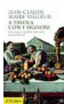
Jean-Claude Maire Vigueur A tavola con i signori il Mulino pp. 368 - euro 36

In una notte d'agosto, in un casale di campagna, è successo qualcosa di terribile e c'è un unico sopravvissuto. La verità sembrava unica e indiscutibile, ma non tutto è come sembra. Tra indizi ingannevoli, mezze verità, segreti e bugie, un thriller psicologico ad altissima tensione.