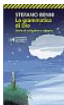
Stefano Benni La grammatica di Dio. Storie di solitudine e allegria Feltrinelli pp. 192 - euro 11

Un articolo che mescola tecniche di cottura e sentimenti rivela a Constance che una metafora culinaria può contenere utilissimi consigli. Un «manuale d'amore» di un tempo in cui per una donna non essere sposata era ancora un problema. Uno sguardo acuto e sorprendentemente attuale sulle relazioni.