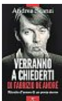
Andrea Scanzi Verranno a chiederti di Fabrizio De André PaperFIRST pp. 224 – euro 16.50