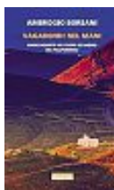
Ambrogio Borsani Vagabondi nel Mani Neri Pozza pp. 160 - euro 18

«Non adagiamoci sulla retorica, sogniamo l'imprevedibile»: così Benni in una vecchia intervista. In questa raccolta di storie ci mostra il lato più bizzarro della vita, con le peripezie di una serie di personaggi indimenticabili. Stefano è andato via, ma in realtà è e sarà sempre qui con noi.