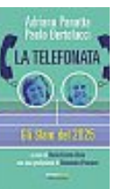
Adriano Panatta, Paolo Bertolucci La telefonata Fandango pp. 252 - euro 17.50

Nella Roma seicentesca si fronteggiano due uomini di genio, due personalità opposte e insieme due visioni dell'arte, della vita, del mondo. L'appassionata rivalità tra i due giganti del Barocco — Gian Lorenzo Bernini e Francesco Borromini —, fra testimonianze storiche e documenti d'archivio.