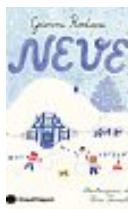
Gianni Rodari Neve Einaudi Ragazzi pp. 64 - euro 18.00

Il banchetto come «teatro di potere»: cibo, arte, politica e diplomazia si fondono nelle sale dei palazzi delle più illustri famiglie del Rinascimento, in uno spettacolo lussuoso e raffinato, frutto di una sapiente organizzazione, in cui niente è lasciato al caso e ogni dettaglio rimanda a un significato.