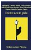
AA.VV. Dodici mesi in giallo Sellerio pp. 540 – euro 18

Un appassionato omaggio, ricco di materiali inediti, a uno dei più grandi cantautori italiani. Il racconto della sua vita e della sua morte, anche attraverso le testimonianze di chi lo ha conosciuto da molto vicino. Le canzoni più celebri si mescolano a ricordi e aneddoti in un ritratto memorabile.