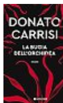
Donato Carrisi La bugia dell'orchidea Longanesi pp. 400 - euro 23

Un lungo e stupendo viaggio in una terra di grandi miti e visioni: gli amori di Elena e Paride, i viaggi di Bruce Chatwin, Patrick Leigh Fermor e la sua casa incantata. Fra torri, faide e leggende piene di guerrieri coraggiosi, Borsani esplora un luogo selvaggio e magico, sospeso tra storia, mito e gli abissi dell'Ade.