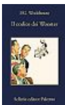
P.G. Wodehouse Il codice dei Wooster Sellerio pp. 300 – euro 16