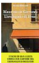
Maurizio de Giovanni L'orologio di Brest Feltrinelli pp. 320 – euro 19

Lo scandalo dei Cambridge Five rivive nella vicenda di Guy Burgess, che in esilio a Mosca affida a un'attrice il compito di fargli confezionare un abito su misura a Londra, e in quella dell'enigmatico Anthony Blunt, coinvolto nella disputa su un Tiziano di proprietà della regina — irresistibile humour inglese.