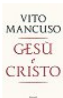
Vito Mancuso Gesù e Cristo Garzanti pp. 780 – euro 25

Per oltre mille anni — a partire dal 200 a.C. —, attraverso una rete di rotte tra Mediterraneo e Asia, dall'India si sono irradiati saperi, religioni e arti: induismo, buddhismo, sistemi di scrittura, medicina, astronomia, letteratura... Una civiltà raffinatissima che ha permeato di sé due continenti.