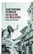
Costantino D'Orazio Sfida per la bellezza. Bernini contro Borromini il Mulino pp. 224 - euro 17