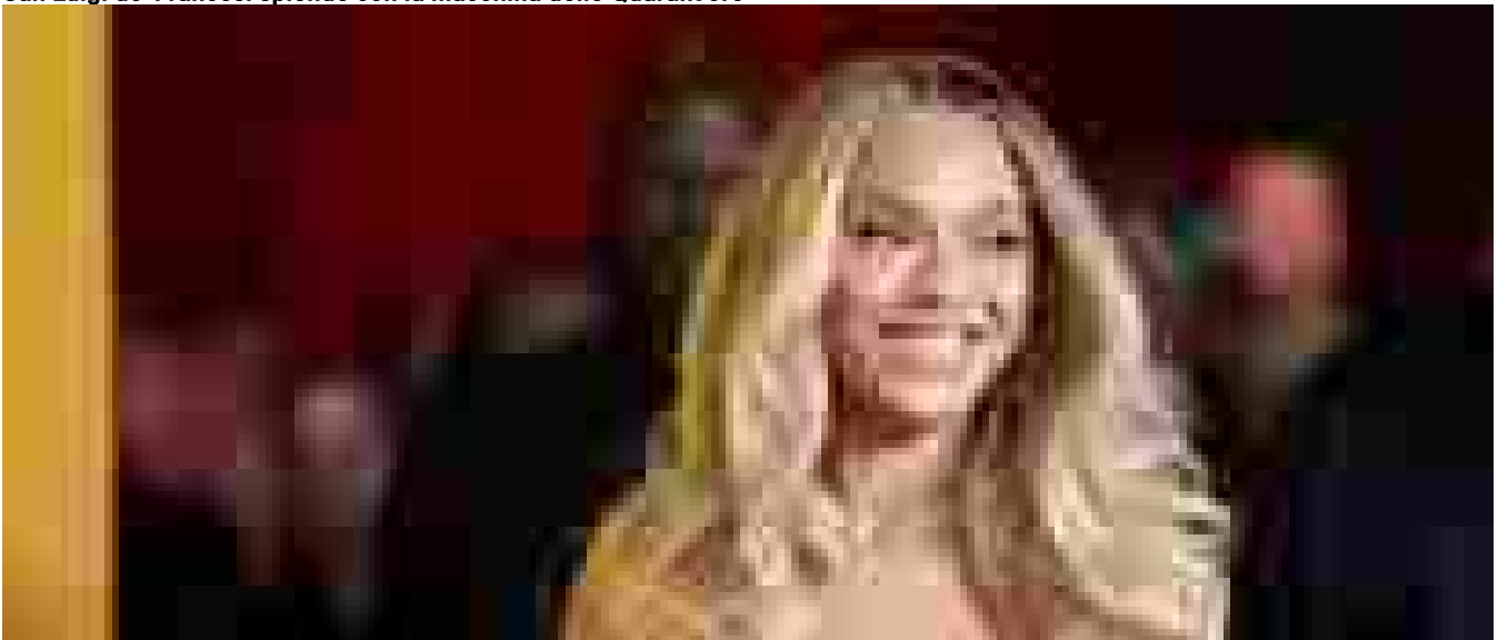
Beyoncé di nuovo snobbata ai premi del country

Ritaglio stampa ad uso esclusivo del destinatario, non riproducibile.