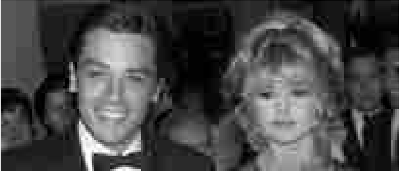
Brigitte Bardot dopo la morte di Delon, 'non ho più nessuno'