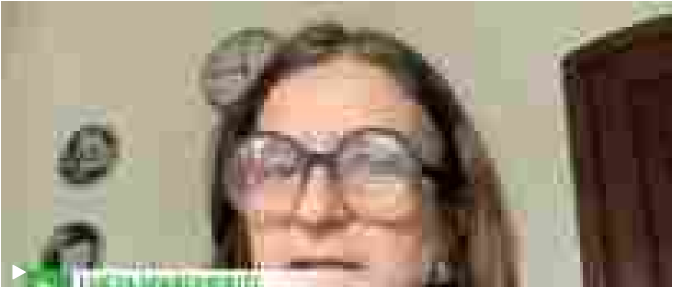
▶ Myanmar, Ingv: 'Attivata una delle faglie più pericolose del sud-est asiatico'