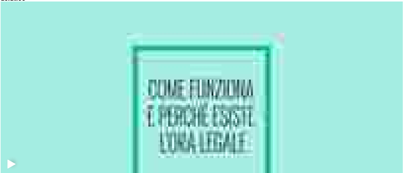
▶ Come funziona e perchè esiste l'ora legale. Questa notte lancette avanti un'ora

Ritaglio stampa ad uso esclusivo del destinatario, non riproducibile.