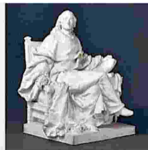
Jean Starobinski Montesquieu Il coraggio della moderazione Nuova edizione Introduzione di Martin Rueff Pinella Bubbiana Felisetti

Da molto tempo esaurito, Montesquieu non è solo il primo libro che Jean Starobinski pubblicò a trent'anni nel 1953. È un saggio che il grande studioso giudicava fondamentale. Se Montesquieu ha accompagnato Starobinski lungo l'arco di tutta la sua vita, è perché fu un pensatore sempre di nuovo attualizzato dalla storia; fu l'uomo della moderazione, un atteggiamento che rende possibile la massima apertura sul mondo e il massimo grado di coinvolgimento nel mondo.