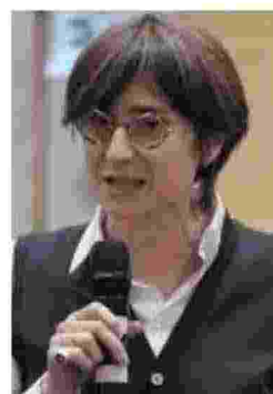
Scrittori in arrivo a Testo, dall'alto a sinistra in senso orario: Alessandro Barbero, Paul Murray, Tracy Chevalier, Chiara Valerio, Stefano Mancuso e Fabio Genovesi

Ritaglio stampa ad uso esclusivo del destinatario, non riproducibile.