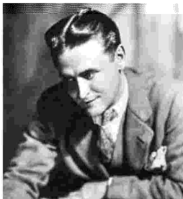
Francis Scott Fitzgerald