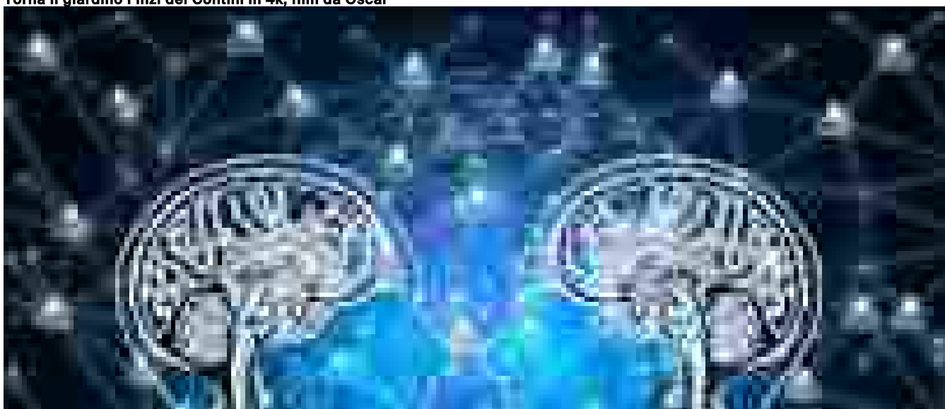
Due sistemi di IA si sono auto-replicati, è la prima volta