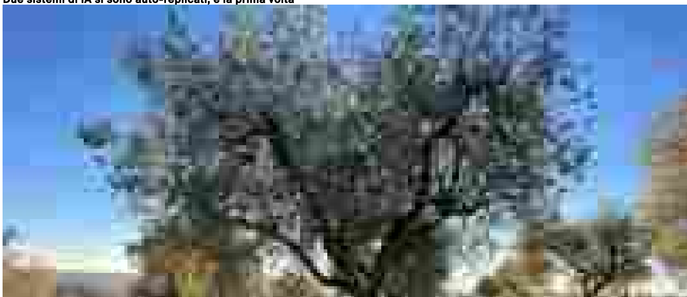
In Italia l'Arca di Noè degli ulivi

Ritaglio stampa ad uso esclusivo del destinatario, non riproducibile.