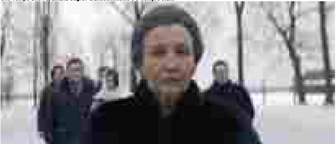
Simone Vell, al cinema la vita della donna del secolo

Ritaglio stampa ad uso esclusivo del destinatario, non riproducibile.