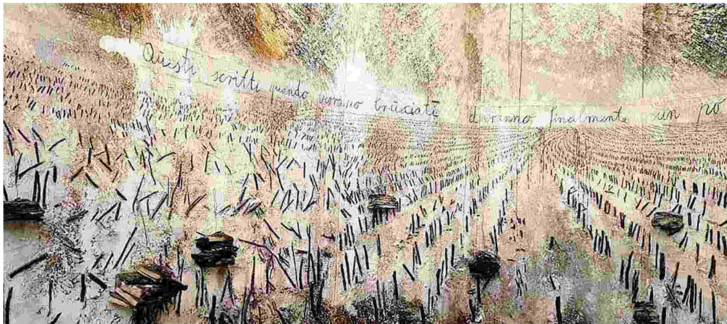
L'opera di Anselm Kiefer, "Questi scritti, quando verranno bruciati, daranno finalmente un po' di luce", esposta al Palazzo Ducale di Venezia nel 2022