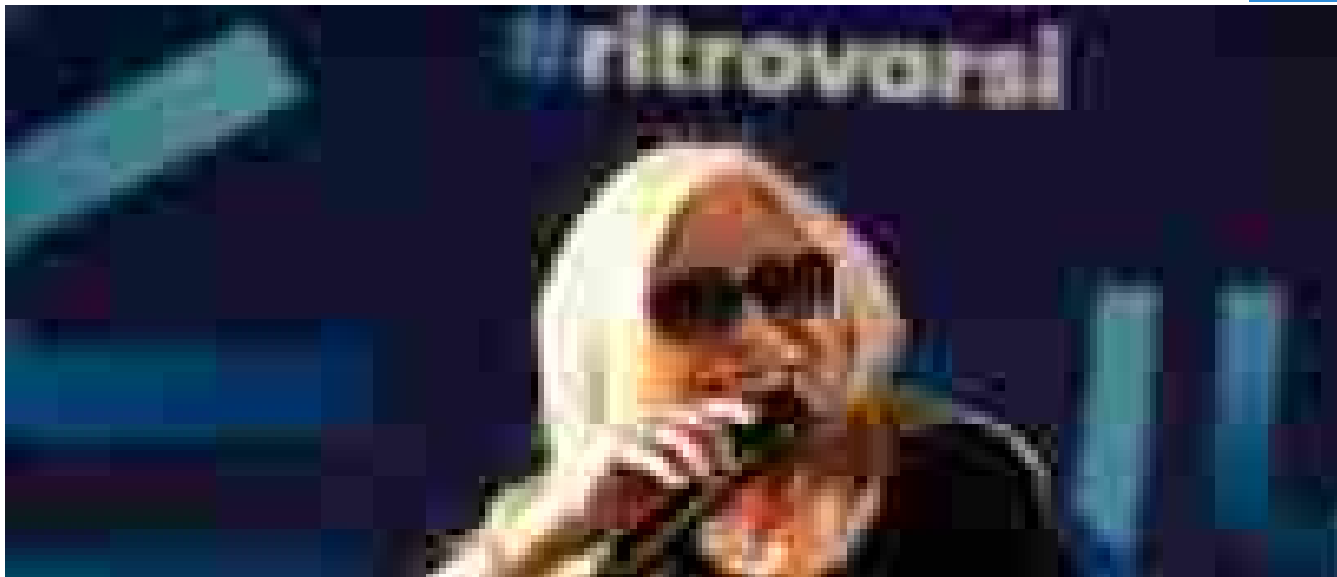
Mara Venier: 'Domenica In? Mi piacerebbero De Martino e Matano'