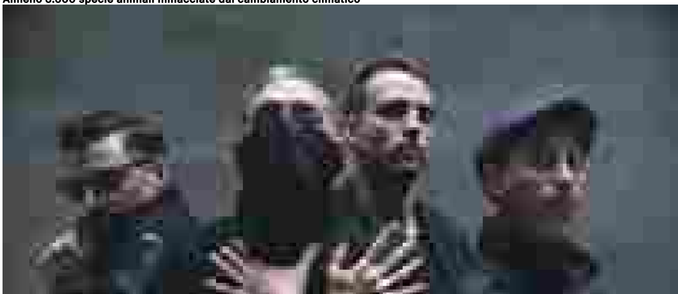
Casino Royale, 'Fumo è il nostro racconto pre-apocalittico'

Ritaglio stampa ad uso esclusivo del destinatario, non riproducibile.