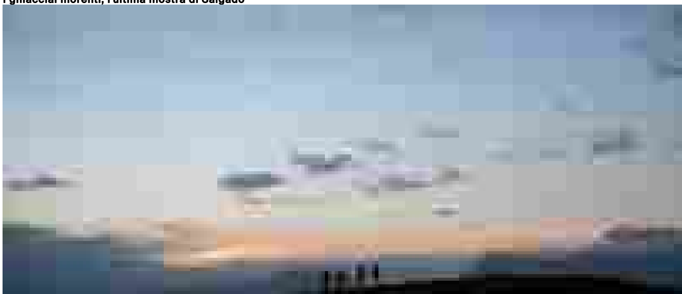
Nocturismo, il fascino di viaggiare di notte

Ritaglio stampa ad uso esclusivo del destinatario, non riproducibile.