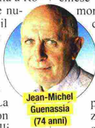
Jean-Michel Guenassia (74 anni)

L e mele caramellate, l'invito a ballare e poi la richiesta di matrimonio. Nella Parigi del 1924, tutta da ricostruire dopo la Prima guerra mondiale, Irène fa la cameriera e si innamora di Georges, un falegname che assomiglia a Rodolfo Valentino; anche per le sue numerose infedeltà. Si apre così il romanzo Sarà quel che sarà , in cui la vicenda di una giovane coppia dalle origini umili fa da cassa di risonanza alla grande Storia del secolo scorso, dagli anni Venti alla fine dei Sessanta. La coppia ha una figlia, Arlène. Con gli amici Thomas e Marie, gemelli di buona famiglia, e Daniel, anche lui membro della borghesia, lei formerà il quartetto di Saint-Maur, come li definisce l'autore. Sono loro i protagonisti nel seguito del romanzo, quattro personaggi ognuno con il proprio destino: c'è chi lo accetta, chi lo subisce e chi invece fa di tutto per esserne l'artefice. Il militare Da-