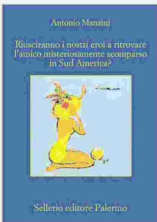
Riusciranno i nostri eroi... Antonio Manzini Sellerio, pp.152, 10 euro

Il vicequestore Rocco Schiavone è in missione non ufficiale a migliaia di chilometri dalla sua odiata Aosta, con il vecchio amico Brizio. Vogliono ritrovare Furio, l'altro compagno di una vita, scomparso tra Buenos Aires, Messico e Costa Rica. Furio, da parte sua, si è lanciato a rotta di collo sulle tracce di Sebastiano, il quarto del gruppo, scappato in Sud America per sfuggire ad una colpa tremenda e alla conseguente punizione.