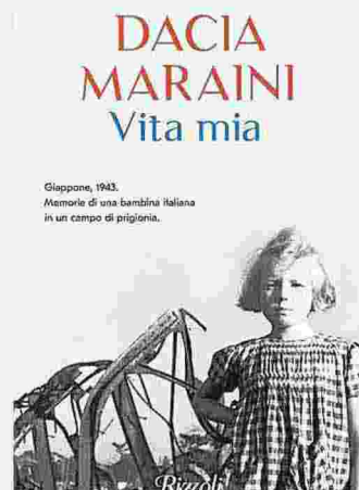
Vita mia Dacia Maraini Rizzoli, pp.224, 18 euro