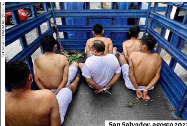
San Salvador, agosto 2022

Ogni anno, in Guatemala, si svolge la Feria internacional del libro, un salone importante soprattutto per il mondo letterario latinoamericano. Come succede in molte di queste manifestazioni, per ogni edizione c'è un paese "ospite d'onore": nella ventesima, che si chiude il 16 luglio, è El Salvador. Pochi giorni prima dell'inizio del salone, la presentazione della raccolta di racconti della pluripremiata scrittrice salvadoregna Michelle Recinos, Sustancia de hígado , è stata cancellata su pressioni dell'ambasciata del Salvador. L'organizzazione del festival