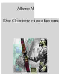
Un'inchiesta critica sul «Don Chisciotte»