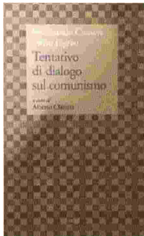
Camon-Ingrao «Tentativo di dialogo sul comunismo» Ediesse ed., pp. 170, 15 euro

Ingrao mi riceve in un salottino, attorno a un tavolinetto basso. Dialogando con lui sulla sua esperienza di pensare e fare il Comunismo avevo l'impressione che quel che diceva fosse meno di quel che pensava e viveva. Sentivo una passione a monte del suo discorso, che il discorso smorzava e riduceva a semplici parole. Sto dicendo che, in un certo senso, chi ha vissuto tutta una vita per fare il comunismo, contrae un'esperienza che in un tempo non comunista non è dicibile e non è comunicabile. C'è tanto d'incomunicabile, al fondo di Ingrao, e forse per questo lui ha tentato le vie della poesia. (dalla premessa di Camon)