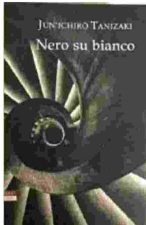
Jun'ichiro Tanizaki «Nero su Bianco» Neri Pozza, pp. 280, 17 euro

Lo scrittore Mizuno ha scritto una storia sull'omicidio perfetto. La sua vittima fittizia è modellata su un conoscente, un collega scrittore. Poco prima che la storia venga pubblicata, Mizuno scopre che il vero nome dell'uomo è stato riportato nel suo manoscritto; tenta di correggere l'errore, ma è troppo tardi. Terrorizzato dall'idea che l'omicidio avvenga per davvero e che lui venga sospettato come colpevole, Mizuno fa di tutto per trovare un alibi, avventurandosi negli inferi della città. Ma finisce solo più involontario nelle sue fantasie paranoiche, in cui un uomo tenta di intrappolarlo.