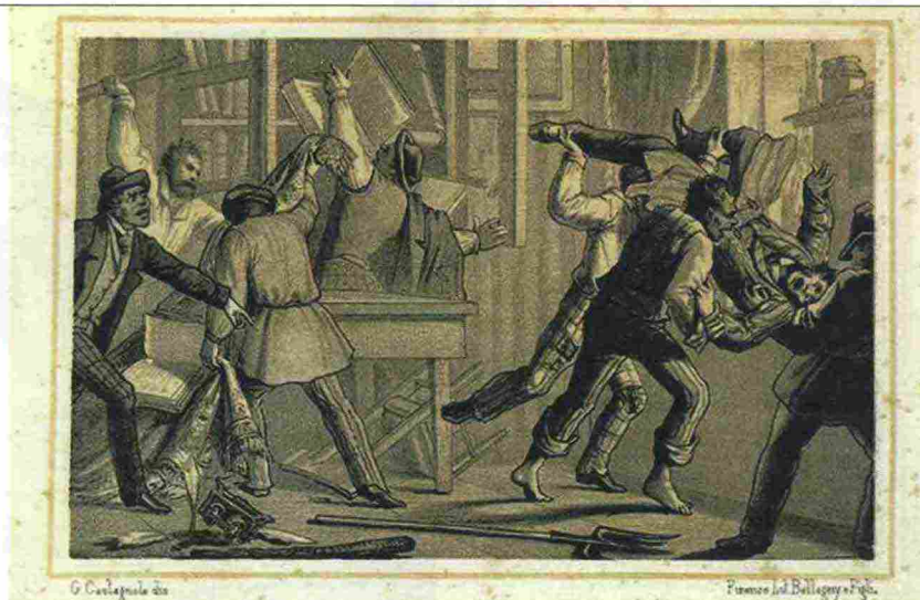
NELLA STAMPA D'EPOCA, IL LINCIAGGIO A MILANO, NEL 1814, DEL CONTE GIUSEPPE PRINA, MINISTRO DELLE FINANZE DEL GOVERNO NAPOLEONICO

Nigro individua alla pari di un taciuto sottotraccia o di un tabù l' affaire Prina nei capitoli dei Promessi sposi dedicati ai tumulti milanesi di San Martino (1628), i moti per il pane in cui Renzo diviene suo malgrado un agitatore rivoluzionario preso in mezzo tra la folla che vorrebbe linciare il Vicario di Provvisione, il presunto affamatore, e l'ineffabile Ferrer (un pezzo grosso degli occupanti spagnoli, ipocritamente bonario) che entra in scena da ambiguo redentore. Così, Nigro rinviene una simile dinamica nelle altre scene di massa, specie quelle relative alla peste e ai monatti, lasciandosi guidare dalle immagini che lo stesso Manzoni aveva commissionato per l'edizione definitiva del romanzo (1840) pagandole un occhio della testa, le vignette del Gonin direttamente incorporate nel testo alla maniera, oggi si direbbe, di un graphic novel; pietra angolare di quanti successivamente hanno, prima che illustrato, sul serio «disegnato» il romanzo: da Renato Guttuso (le cui tavole sono inserite nella controversa edizione Einaudi del 1960, introdotta da un per una volta improvvido, Alberto Moravia che dà a Manzoni del «realista cattolico» quasi fosse un antesignano del «realismo socialista») fino a Mimmo Paladino il cui stupendo disegno ispirato al capitolo VI, lo