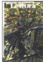
La copertina della Lettura del 31 dicembre 2017 disegnata da Paolo Conte