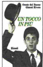
Un tocco in più di Oreste Del Buono e Gianni Rivera, pubblicato nel 1966 da Rizzoli